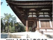
0006_入口から高床まで