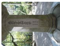
0037_入口から高床まで