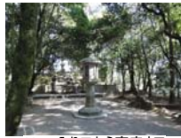
0023_入口から高床まで