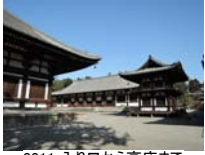
0011_入口から高床まで