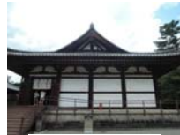
0254_看板から講堂まで