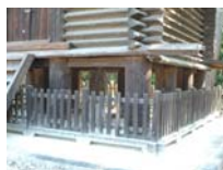
0043_入口から高床まで