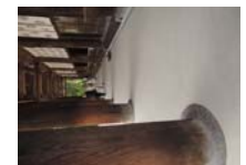
0238_看板から講堂まで