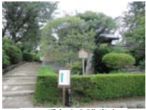
0256_看板から講堂まで