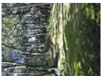
0036_入口から高床まで