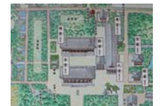
0235_看板から講堂まで