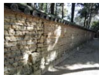
0039_入口から高床まで