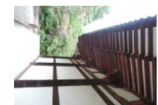
0249_看板から講堂まで