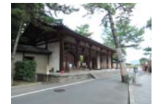
0228_看板から講堂まで