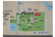
0226_看板から講堂まで