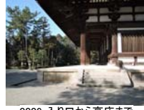
0009_入口から高床まで