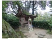
0259_看板から講堂まで