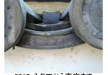
0015_入口から高床まで