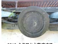
0012_入口から高床まで