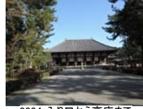
0004_入口から高床まで