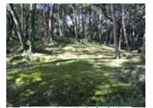
0035_入口から高床まで