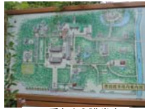
0258_看板から講堂まで