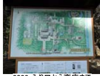
0003_入口から高床まで