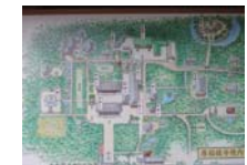
0234_看板から講堂まで