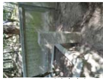
0028_入口から高床まで