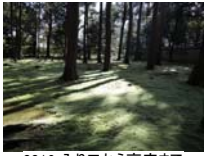
0016_入口から高床まで