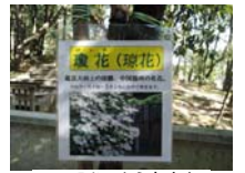
0030_入口から高床まで