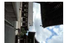
0240_看板から講堂まで