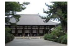
0233_看板から講堂まで