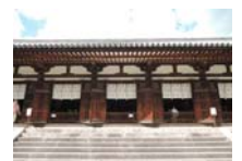
0246_看板から講堂まで