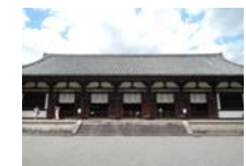
0244_看板から講堂まで