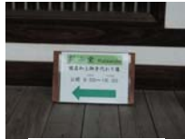
0253_看板から講堂まで