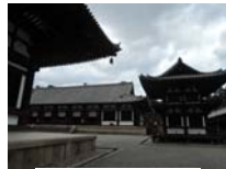
0265_看板から講堂まで