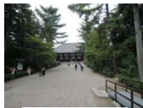
0268_看板から講堂まで