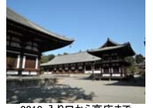
0010_入口から高床まで