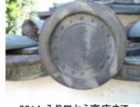
0014_入口から高床まで