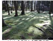
0019_入口から高床まで