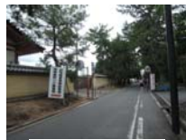
0270_看板から講堂まで