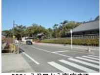
0001_入口から高床まで