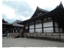
0260_看板から講堂まで