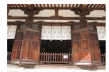
0247_看板から講堂まで