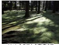
0018_入口から高床まで