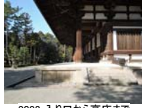
0008_入口から高床まで