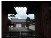
0273_看板から講堂まで