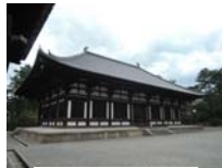
0263_看板から講堂まで