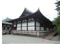
0255_看板から講堂まで