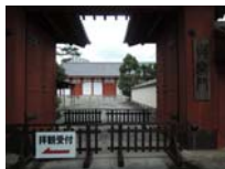
0272_看板から講堂まで