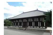
0248_看板から講堂まで