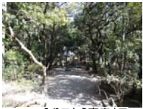
0021_入口から高床まで