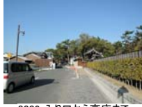
0002_入口から高床まで