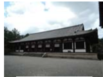
0264_看板から講堂まで