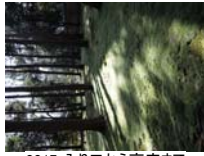
0017_入口から高床まで