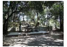
0025_入口から高床まで