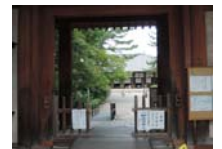
0231_看板から講堂まで