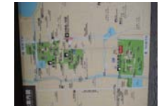
0224_看板から講堂まで