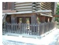
0044_入口から高床まで