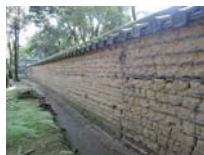
0038_入口から高床まで