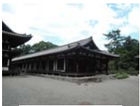
0266_看板から講堂まで