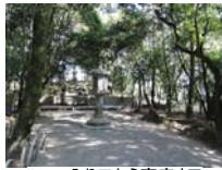
0022_入口から高床まで