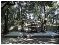
0026_入口から高床まで