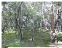
0032_入口から高床まで