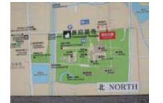
0225_看板から講堂まで