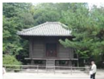
0267_看板から講堂まで