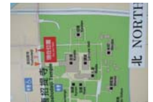
0227_看板から講堂まで