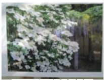
0031_入口から高床まで