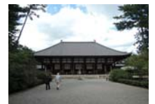
0236_看板から講堂まで