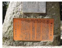
0034_入口から高床まで