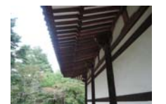
0250_看板から講堂まで