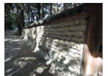
0040_入口から高床まで