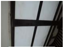
0261_看板から講堂まで