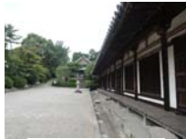
0252_看板から講堂まで