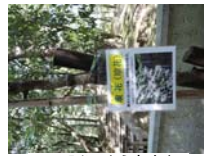
0029_入口から高床まで