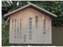
0257_看板から講堂まで