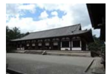
0241_看板から講堂まで