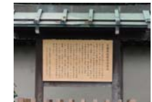
0229_看板から講堂まで