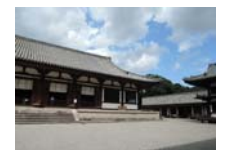
0245_看板から講堂まで