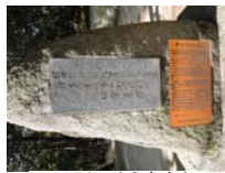
0033_入口から高床まで