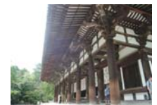
0237_看板から講堂まで