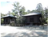
0041_入口から高床まで