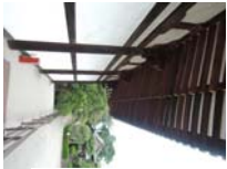
0251_看板から講堂まで