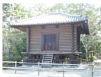
0042_入口から高床まで