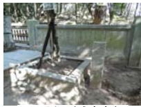
0027_入口から高床まで