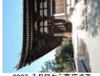
0007_入口から高床まで