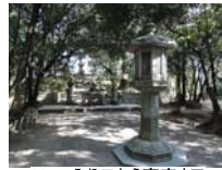
0024_入口から高床まで