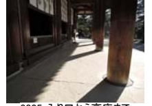
0005_入口から高床まで