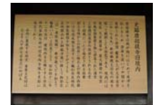
0230_看板から講堂まで