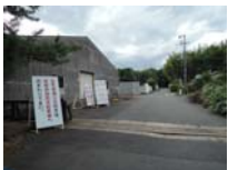
0271_看板から講堂まで