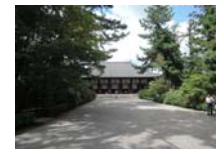
0232_看板から講堂まで