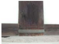
0262_看板から講堂まで