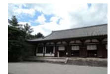
0243_看板から講堂まで