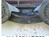
0013_入口から高床まで