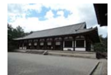
0242_看板から講堂まで