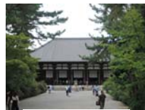
0269_看板から講堂まで