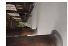
0239_看板から講堂まで