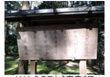
0020_入口から高床まで