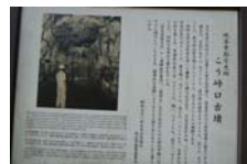
0023_こう峠古墳説明板