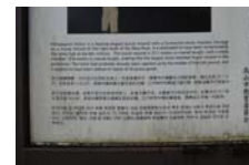
0025_こう峠古墳説明板