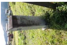
0026_こう峠古墳説明板