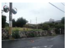
0137_錦織遺跡第2地点と7地点との間の三差路