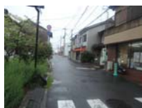
0188_錦織遺跡第8地点・西北角