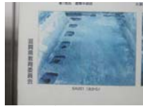
0114_錦織遺跡第1地点・下の段