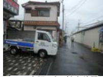
0008_京阪・近江神宮前駅