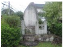
0116_錦織遺跡第1地点・下の段