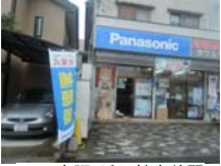
0006_京阪・近江神宮前駅