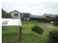
0083_錦織遺跡第1地点・上の段