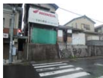
0183_錦織遺跡第8地点・西北角