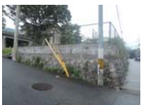
0071_近江大津宮・錦織遺跡第9地点