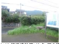
0107_錦織遺跡第1地点・下の段