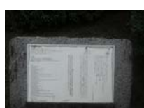
0095_錦織遺跡第1地点・上の段