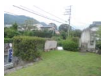
0089_錦織遺跡第1地点・上の段