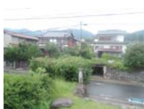
0087_錦織遺跡第1地点・上の段