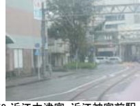
0059_近江大津宮・近江神宮前駅・京阪