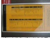
0052_近江大津宮・近江神宮前駅・京阪