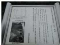
0117_錦織遺跡第1地点・下の段