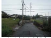
0063_近江大津宮・錦織遺跡第9地点