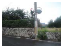
0073_近江大津宮・錦織遺跡第9地点