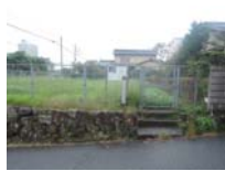
0068_近江大津宮・錦織遺跡第9地点