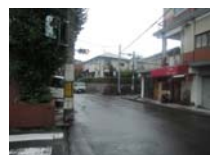
0190_錦織遺跡第8地点・西北角