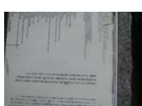
0098_錦織遺跡第1地点・上の段