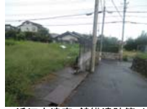
0065_近江大津宮・錦織遺跡第9地点