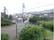
0086_錦織遺跡第1地点・上の段