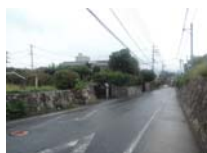
0138_錦織遺跡第2地点と7地点との間の三差路