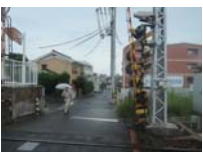
0041_近江大津宮・近江神宮前駅・京阪