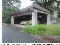
0060_近江大津宮・錦織遺跡第9地点