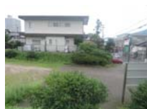
0085_錦織遺跡第1地点・上の段