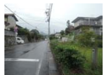
0185_錦織遺跡第8地点・西北角