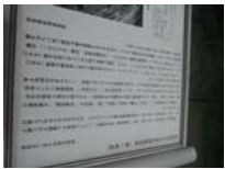
0076_錦織遺跡第1地点・上の段