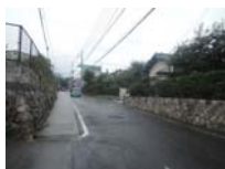
0072_近江大津宮・錦織遺跡第9地点