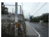
0142_錦織遺跡第2地点と7地点との間の三差路