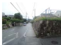
0139_錦織遺跡第2地点と7地点との間の三差路