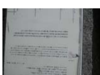
0097_錦織遺跡第1地点・上の段