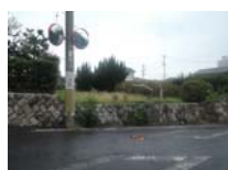
0145_錦織遺跡第2地点と7地点との間の三差路