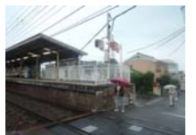
0040_近江大津宮・近江神宮前駅・京阪