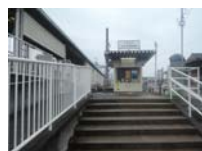
0049_近江大津宮・近江神宮前駅・京阪