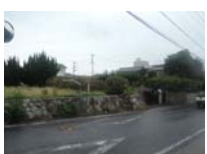
0146_錦織遺跡第2地点と7地点との間の三差路