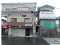
0182_錦織遺跡第8地点・西北角