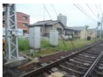
0042_近江大津宮・近江神宮前駅・京阪