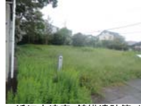
0064_近江大津宮・錦織遺跡第9地点