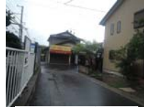
0004_京阪・近江神宮前駅