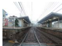
0039_近江大津宮・近江神宮前駅・京阪