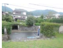
0088_錦織遺跡第1地点・上の段