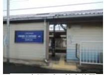
0010_京阪・近江神宮前駅