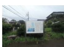
0100_錦織遺跡第1地点・下の段