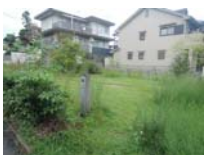
0186_錦織遺跡第8地点・西北角