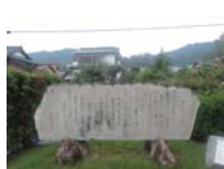
0093_錦織遺跡第1地点・上の段