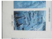
0115_錦織遺跡第1地点・下の段