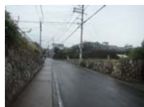
0075_近江大津宮・錦織遺跡第9地点