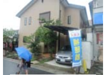
0005_京阪・近江神宮前駅