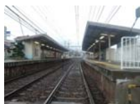
0048_近江大津宮・近江神宮前駅・京阪