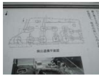
0078_錦織遺跡第1地点・上の段