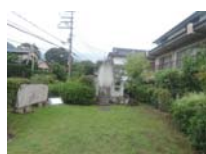
0090_錦織遺跡第1地点・上の段