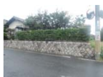
0144_錦織遺跡第2地点と7地点との間の三差路