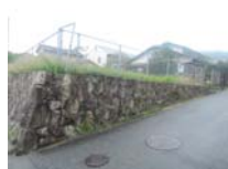
0140_錦織遺跡第2地点と7地点との間の三差路