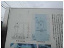
0111_錦織遺跡第1地点・下の段