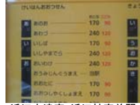
0054_近江大津宮・近江神宮前駅・京阪