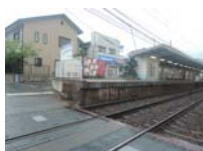
0047_近江大津宮・近江神宮前駅・京阪