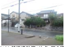
0106_錦織遺跡第1地点・下の段