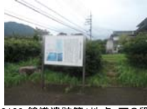
0108_錦織遺跡第1地点・下の段