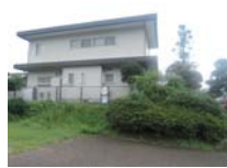
0104_錦織遺跡第1地点・下の段