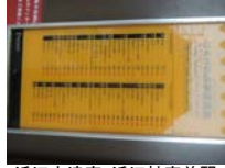
0053_近江大津宮・近江神宮前駅・京阪