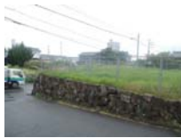
0067_近江大津宮・錦織遺跡第9地点