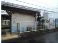
0002_京阪・近江神宮前駅