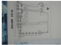
0113_錦織遺跡第1地点・下の段