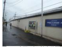
0009_京阪・近江神宮前駅