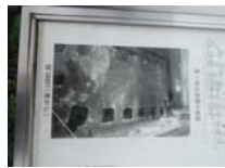
0119_錦織遺跡第1地点・下の段