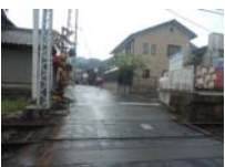
0046_近江大津宮・近江神宮前駅・京阪