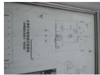
0079_錦織遺跡第1地点・上の段