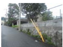
0141_錦織遺跡第2地点と7地点との間の三差路