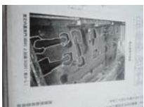
0081_錦織遺跡第1地点・上の段