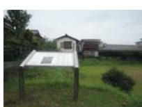
0092_錦織遺跡第1地点・上の段