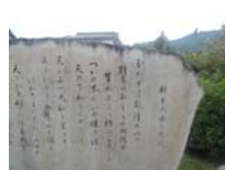
0094_錦織遺跡第1地点・上の段