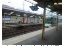
0055_近江大津宮・近江神宮前駅・京阪