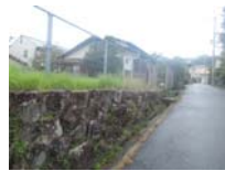
0069_近江大津宮・錦織遺跡第9地点