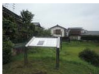
0082_錦織遺跡第1地点・上の段