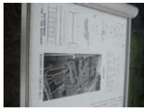
0077_錦織遺跡第1地点・上の段