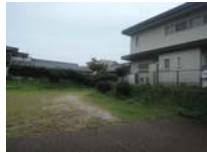
0103_錦織遺跡第1地点・下の段