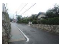
0143_錦織遺跡第2地点と7地点との間の三差路