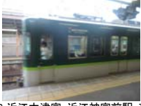
0056_近江大津宮・近江神宮前駅・京阪