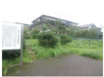
0101_錦織遺跡第1地点・下の段