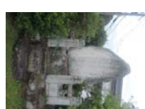
0099_錦織遺跡第1地点・上の段