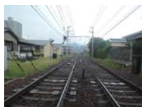
0043_近江大津宮・近江神宮前駅・京阪