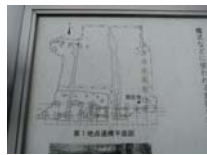
0120_錦織遺跡第1地点・下の段