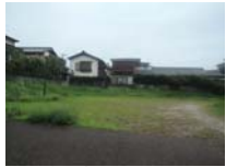
0102_錦織遺跡第1地点・下の段