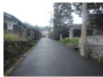
0070_近江大津宮・錦織遺跡第9地点