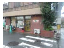
0189_錦織遺跡第8地点・西北角