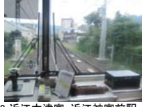
0058_近江大津宮・近江神宮前駅・京阪