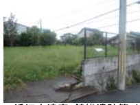
0062_近江大津宮・錦織遺跡第9地点