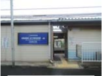
0001_京阪・近江神宮前駅