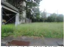
0061_近江大津宮・錦織遺跡第9地点