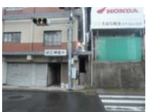
0191_錦織遺跡第8地点・西北角