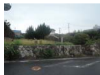
0074_近江大津宮・錦織遺跡第9地点