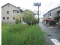
0187_錦織遺跡第8地点・西北角