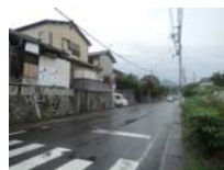
0184_錦織遺跡第8地点・西北角