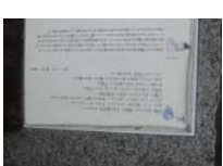
0096_錦織遺跡第1地点・上の段