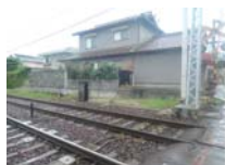
0045_近江大津宮・近江神宮前駅・京阪