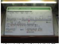
0051_近江大津宮・近江神宮前駅・京阪