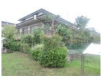
0091_錦織遺跡第1地点・上の段