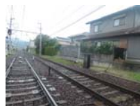
0044_近江大津宮・近江神宮前駅・京阪