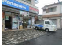
0007_京阪・近江神宮前駅