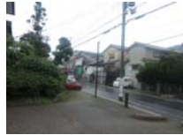
0105_錦織遺跡第1地点・下の段