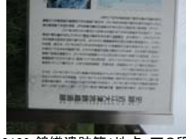
0109_錦織遺跡第1地点・下の段