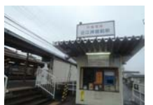
0050_近江大津宮・近江神宮前駅・京阪