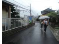
0003_京阪・近江神宮前駅