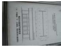
0080_錦織遺跡第1地点・上の段