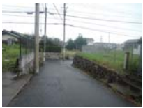
0066_近江大津宮・錦織遺跡第9地点