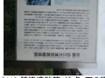
0110_錦織遺跡第1地点・下の段