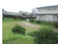
0084_錦織遺跡第1地点・上の段