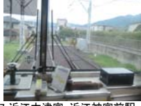
0057_近江大津宮・近江神宮前駅・京阪