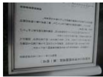
0118_錦織遺跡第1地点・下の段