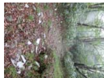
0024_位山峠・萩原への降りる道