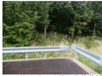
0007_位山峠の手前の水芭蕉橋