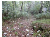
0025_位山峠・萩原への降りる道