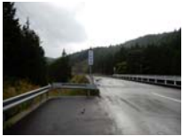
0001_位山峠の手前の水芭蕉橋