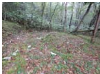
0022_位山峠・萩原への降りる道