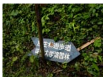
0032_位山峠山頂付近・石畳(復元)