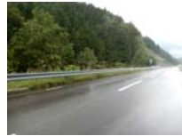
0004_位山峠の手前の水芭蕉橋