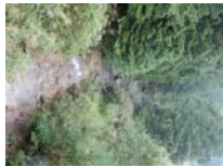
0012_位山峠の手前の水芭蕉橋