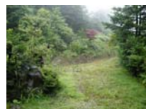
0035_位山峠山頂付近・石畳(復元)