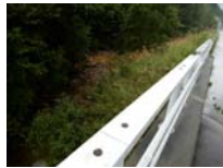
0013_位山峠の手前の水芭蕉橋