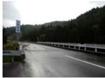
0002_位山峠の手前の水芭蕉橋