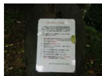
0034_位山峠山頂付近・石畳(復元)