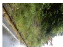
0044_位山峠石碑下の道・四方