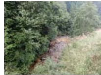
0015_位山峠の手前の水芭蕉橋