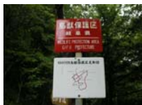
0027_位山峠山頂付近・石畳(復元)