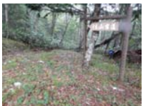
0021_位山峠・萩原への降りる道