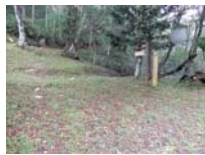
0018_位山峠・萩原への降りる道