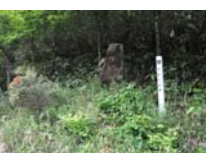
0036_位山峠山頂付近・石畳(復元)