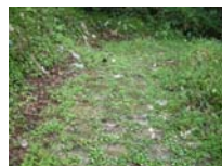
0029_位山峠山頂付近・石畳(復元)