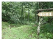
0028_位山峠山頂付近・石畳(復元)