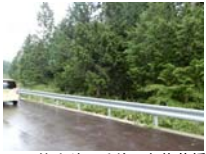
0006_位山峠の手前の水芭蕉橋