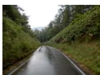
0042_位山峠石碑下の道・四方