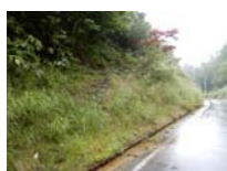
0043_位山峠石碑下の道・四方