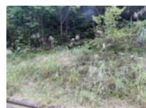
0040_位山峠石碑下の道・四方