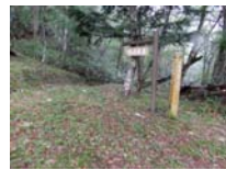
0020_位山峠・萩原への降りる道