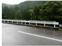
0003_位山峠の手前の水芭蕉橋