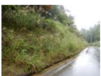
0041_位山峠石碑下の道・四方