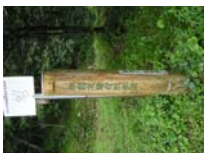
0026_位山峠山頂付近・石畳(復元)