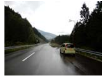
0005_位山峠の手前の水芭蕉橋