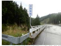
0008_位山峠の手前の水芭蕉橋