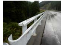
0010_位山峠の手前の水芭蕉橋