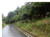
0039_位山峠石碑下の道・四方