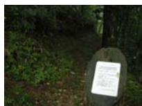
0033_位山峠山頂付近・石畳(復元)