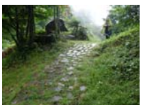
0031_位山峠山頂付近・石畳(復元)