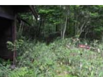
0037_位山峠山頂付近・石畳(復元)