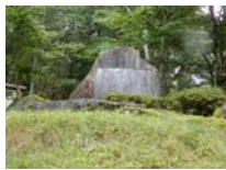
0017_位山峠・萩原への降りる道