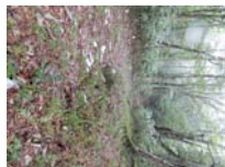
0023_位山峠・萩原への降りる道