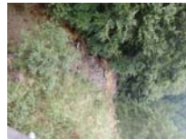
0014_位山峠の手前の水芭蕉橋