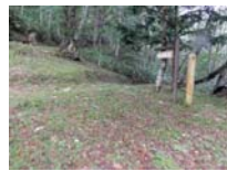
0019_位山峠・萩原への降りる道