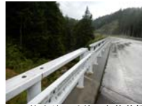
0009_位山峠の手前の水芭蕉橋