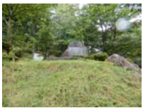
0016_位山峠・萩原への降りる道