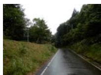
0038_位山峠石碑下の道・四方