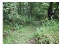
0030_位山峠山頂付近・石畳(復元)