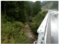
0011_位山峠の手前の水芭蕉橋