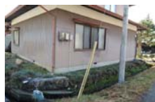
0080_県道473号まで北へ戻った位置、用水