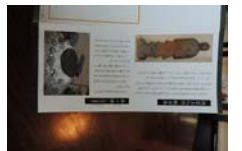
0030_木曾垣内 大仏 リーフ