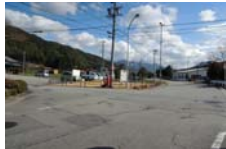
0052_木曾垣内の大仏 周囲