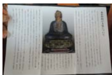
0033_木曾垣内 大仏 リーフ