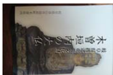
0032_木曾垣内 大仏 リーフ