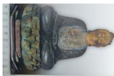
0037_木曾垣内 大仏 リーフ