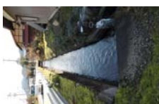
0086_県道473号まで北へ戻った位置、用水