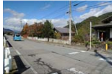
0059_木曾垣内の大仏 周囲