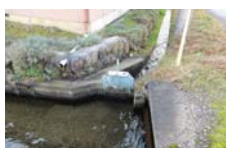
0087_県道473号まで北へ戻った位置、用水