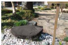
0061_木曾垣内の大仏 周囲