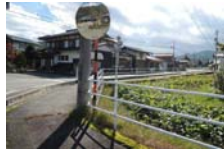
0054_木曾垣内の大仏 周囲