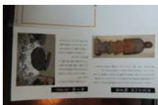
0031_木曾垣内 大仏 リーフ