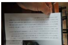
0036_木曾垣内 大仏 リーフ