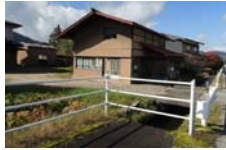
0057_木曾垣内の大仏 周囲