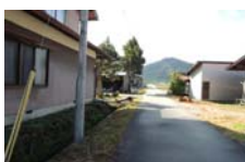
0081_県道473号まで北へ戻った位置、用水