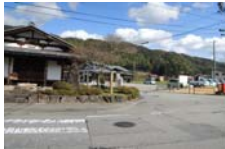
0051_木曾垣内の大仏 周囲