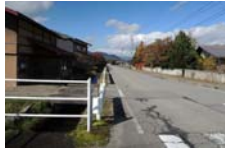
0058_木曾垣内の大仏 周囲