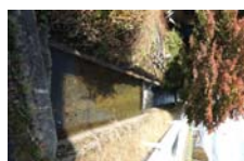
0085_県道473号まで北へ戻った位置、用水