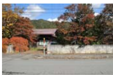
0076_県道473号まで北へ戻った位置、用水