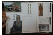
0029_木曾垣内 大仏 リーフ