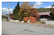
0075_県道473号まで北へ戻った位置、用水