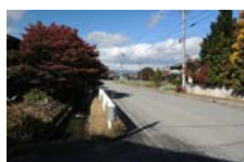
0084_県道473号まで北へ戻った位置、用水