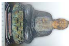
0038_木曾垣内 大仏 リーフ