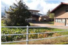
0056_木曾垣内の大仏 周囲