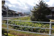
0055_木曾垣内の大仏 周囲