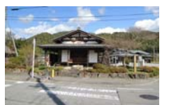
0050_木曾垣内の大仏 周囲