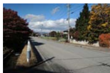
0074_県道473号まで北へ戻った位置、用水