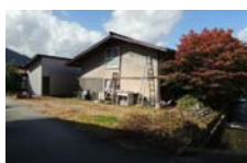
0083_県道473号まで北へ戻った位置、用水