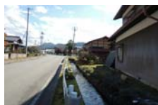
0079_県道473号まで北へ戻った位置、用水