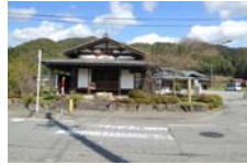
0060_木曾垣内の大仏 周囲