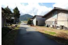
0082_県道473号まで北へ戻った位置、用水