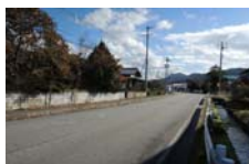
0078_県道473号まで北へ戻った位置、用水