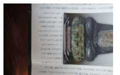
0035_木曾垣内 大仏 リーフ