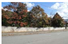
0077_県道473号まで北へ戻った位置、用水