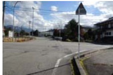
0053_木曾垣内の大仏 周囲