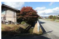
0073_県道473号まで北へ戻った位置、用水