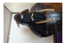
0021_龟塚甲冑展示状況