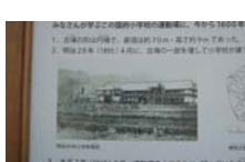
0032_龟塚跡・国府小学校