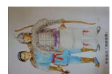
0028_龟塚甲冑展示状況