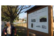
0037_龟塚跡・国府小学校