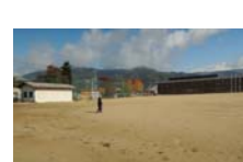
0045_龟塚跡・国府小学校