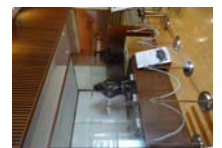
0016_龟塚甲冑展示状況