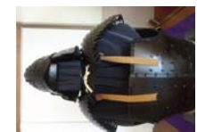
0019_龟塚甲冑展示状況