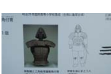
0041_龟塚跡・国府小学校