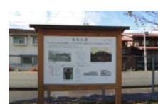
0030_龟塚跡・国府小学校