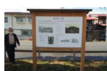
0029_龟塚跡・国府小学校