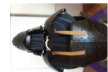
0020_龟塚甲冑展示状況