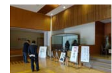
0025_龟塚甲冑展示状況