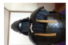
0022_龟塚甲冑展示状況