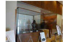
0015_龟塚甲冑展示状況