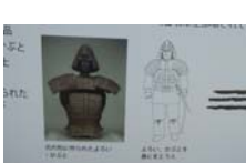
0036_龟塚跡・国府小学校