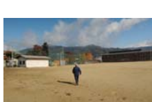
0042_龟塚跡・国府小学校