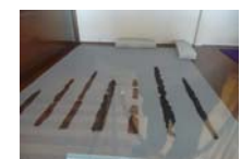
0024_龟塚甲冑展示状況