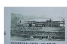
0040_龟塚跡・国府小学校