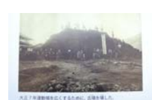
0035_龟塚跡・国府小学校