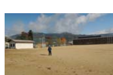
0044_龟塚跡・国府小学校