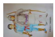
0027_龟塚甲冑展示状況