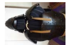
0018_龟塚甲冑展示状況