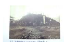
0034_龟塚跡・国府小学校