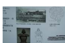
0039_龟塚跡・国府小学校