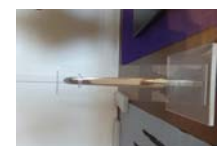
0023_龟塚甲冑展示状況