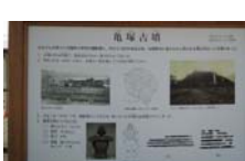
0031_龟塚跡・国府小学校