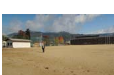
0046_龟塚跡・国府小学校