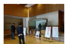
0026_龟塚甲冑展示状況