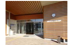
0014_龟塚甲冑展示状況