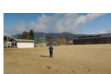
0043_龟塚跡・国府小学校