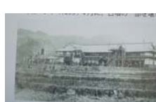
0033_龟塚跡・国府小学校