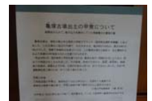
0017_龟塚甲冑展示状況