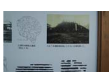
0038_龟塚跡・国府小学校