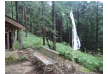
0070_川合平休憩所・馬頭観音