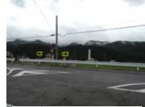
0104_初矢から乗政に出た所