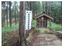
0077_川合平休憩所・馬頭観音