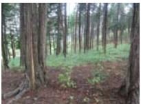
0076_川合平休憩所・馬頭観音