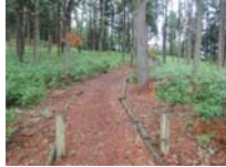
0052_川合平休憩所・馬頭観音