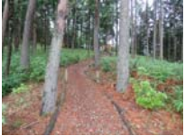
0051_川合平休憩所・馬頭観音