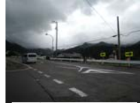
0103_初矢から乗政に出た所