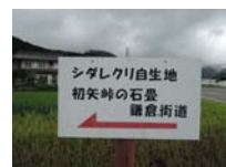
0099_初矢から乗政に出た所