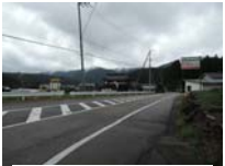
0106_初矢から乗政に出た所