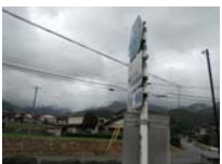
0126_初矢から乗政に出た所