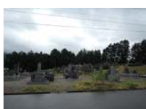
0047_川合平休憩所・県道からの入り口