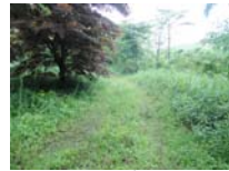
0015_川合平休憩所・初矢から上がった所