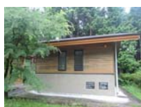
0043_川合平休憩所・建物