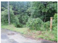
0021_川合平休憩所・峠360度