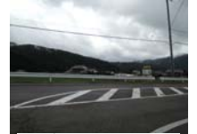
0105_初矢から乗政に出た所