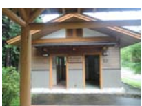
0046_川合平休憩所・建物