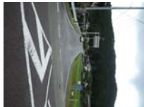
0112_初矢から乗政に出た所