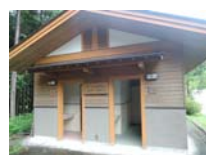
0045_川合平休憩所・建物