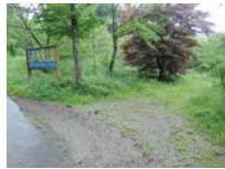
0013_川合平休憩所・初矢から上がった所