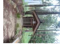
0059_川合平休憩所・馬頭観音