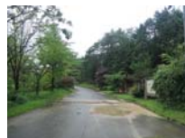
0029_川合平休憩所・峠360度