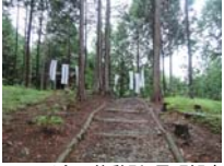
0056_川合平休憩所・馬頭観音