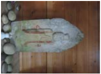
0066_川合平休憩所・馬頭観音