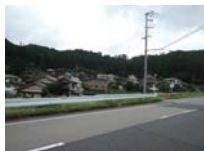
0122_初矢から乗政に出た所