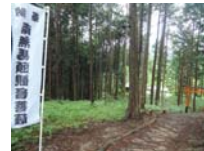
0074_川合平休憩所・馬頭観音