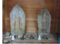
0063_川合平休憩所・馬頭観音