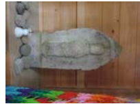
0068_川合平休憩所・馬頭観音