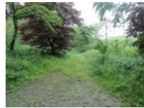
0014_川合平休憩所・初矢から上がった所