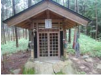
0061_川合平休憩所・馬頭観音