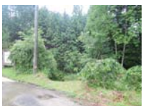
0031_川合平休憩所・峠360度