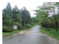
0034_川合平休憩所・峠360度