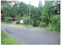
0001_川合平休憩所・乗政集落に降りる所