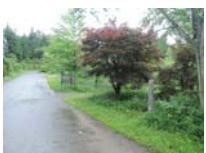
0036_川合平休憩所・峠360度