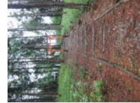
0054_川合平休憩所・馬頭観音