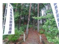
0050_川合平休憩所・馬頭観音