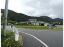
0101_初矢から乗政に出た所