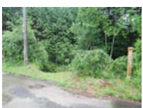
0041_川合平休憩所・峠360度