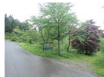
0025_川合平休憩所・峠360度