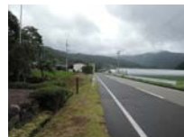
0119_初矢から乗政に出た所