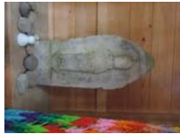
0067_川合平休憩所・馬頭観音