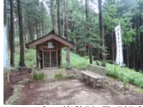
0057_川合平休憩所・馬頭観音