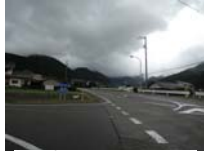
0102_初矢から乗政に出た所