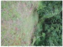
0006_川合平休憩所・乗政集落に降りる所