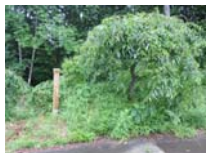
0022_川合平休憩所・峠360度