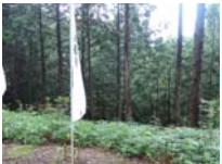
0071_川合平休憩所・馬頭観音