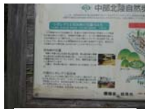
0018_川合平休憩所・地図