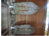
0062_川合平休憩所・馬頭観音