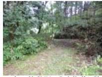
0008_川合平休憩所・乗政集落に降りる所