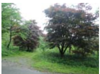
0026_川合平休憩所・峠360度