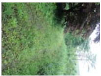
0016_川合平休憩所・初矢から上がった所