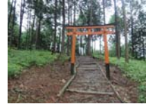
0055_川合平休憩所・馬頭観音