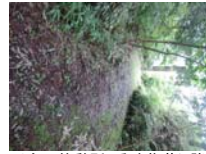
0010_川合平休憩所・乗政集落に降りる所