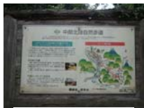
0017_川合平休憩所・地図