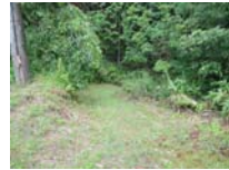
0005_川合平休憩所・乗政集落に降りる所