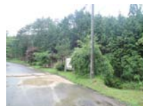
0030_川合平休憩所・峠360度