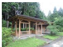
0033_川合平休憩所・峠360度