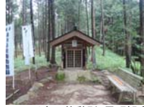
0058_川合平休憩所・馬頭観音