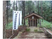
0069_川合平休憩所・馬頭観音