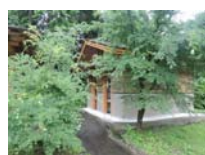
0044_川合平休憩所・建物