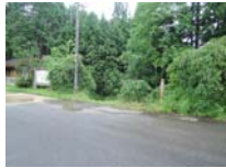
0002_川合平休憩所・乗政集落に降りる所