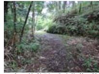
0009_川合平休憩所・乗政集落に降りる所