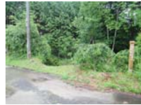
0004_川合平休憩所・乗政集落に降りる所