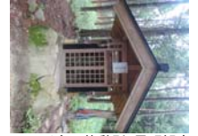
0060_川合平休憩所・馬頭観音