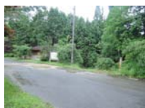
0038_川合平休憩所・峠360度