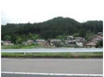
0121_初矢から乗政に出た所