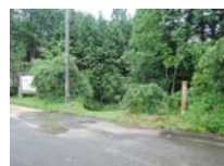
0040_川合平休憩所・峠360度