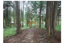
0075_川合平休憩所・馬頭観音