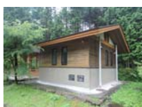
0042_川合平休憩所・建物