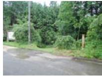
0003_川合平休憩所・乗政集落に降りる所