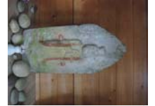
0065_川合平休憩所・馬頭観音