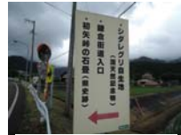
0109_初矢から乗政に出た所