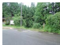
0039_川合平休憩所・峠360度