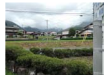
0125_初矢から乗政に出た所