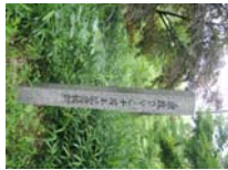
0012_川合平休憩所・初矢から上がった所