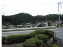
0117_初矢から乗政に出た所