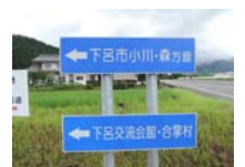
0100_初矢から乗政に出た所