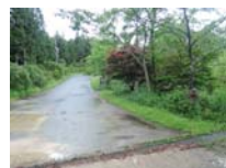
0035_川合平休憩所・峠360度