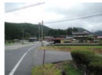
0124_初矢から乗政に出た所