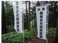
0072_川合平休憩所・馬頭観音