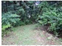
0007_川合平休憩所・乗政集落に降りる所