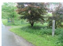
0037_川合平休憩所・峠360度