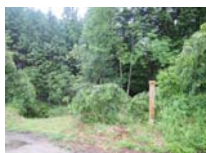
0032_川合平休憩所・峠360度