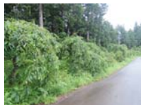
0023_川合平休憩所・峠360度