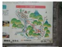
0019_川合平休憩所・地図