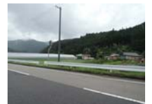
0120_初矢から乗政に出た所