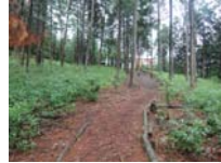
0053_川合平休憩所・馬頭観音