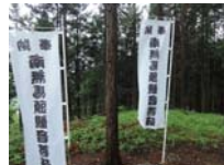
0073_川合平休憩所・馬頭観音