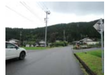
0115_初矢から乗政に出た所