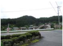
0116_初矢から乗政に出た所