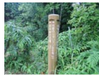
0020_川合平休憩所・峠360度