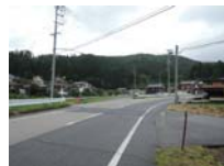
0123_初矢から乗政に出た所