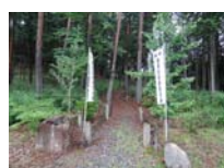
0049_川合平休憩所・馬頭観音