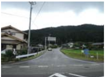
0111_初矢から乗政に出た所