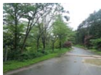
0028_川合平休憩所・峠360度