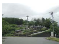
0048_川合平休憩所・県道からの入り口