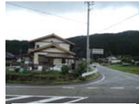
0108_初矢から乗政に出た所