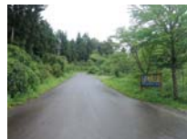
0024_川合平休憩所・峠360度