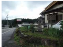
0107_初矢から乗政に出た所