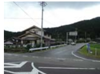
0113_初矢から乗政に出た所