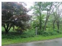
0027_川合平休憩所・峠360度