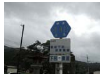
0118_初矢から乗政に出た所