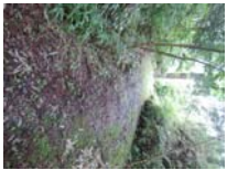
0011_川合平休憩所・乗政集落に降りる所