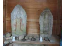
0064_川合平休憩所・馬頭観音