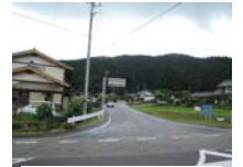
0110_初矢から乗政に出た所