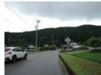
0114_初矢から乗政に出た所