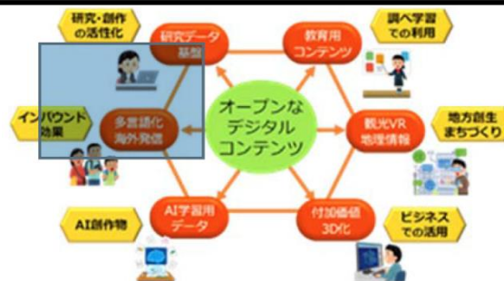
デジタルアーカイブ社会のイメージ(例)

(Europeanaの「アグリゲーター」、DPLAの「ハブ」に相当)は、メタデータを取りまとめて、国の分野横断統合ポータル(国立国会図書館が検討を進める「ジャパンサーチ(仮称)」)と共有できるようにする。活用者は、ジャパンサーチ(仮称)等を通じて、共有されるメタデータやデジタルコンテンツをデータ提供者のメリットにつながる形で、様々な用途に活用することができる。