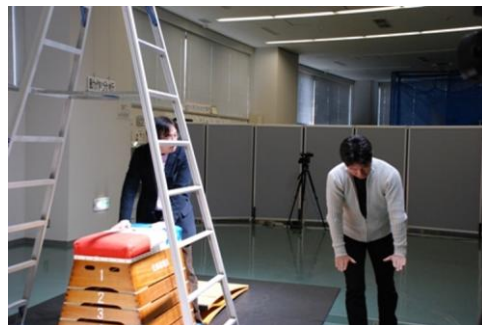
写真2 専門家の指導

また同月下旬には、A小学校の3年生を対象に、開脚跳びを撮影した(写真3)。A小学校の体育館の舞台に跳び箱を設定し、正面、前面、後面、上面の4方向から同時に撮影を行った。この撮影においても、前段で述べた動作分析の専門家2名に協力していただいた。児童全員に開脚跳びをしてもらい、その中でうまく跳べない2名にポイントをつけて撮影した。