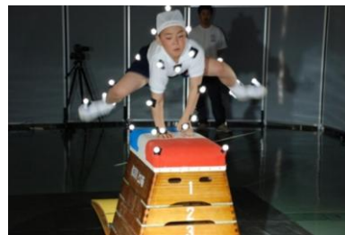
写真1 ポイントをつけた撮影

2009年3月に小学生の開脚跳びを撮影した。この撮影は、連携協定を結んでいる岐阜県スポーツ科学トレーニングセンター(以下、SSTCと示す)にて行った。正面、前面、後面、上面、斜め前面の多方向から同時に撮影を行った後、動作分析の専門家2名の指導の下、児童の関節などにポイントをつけて撮影した(写真1)。また、今回の撮影でも、小学校体育主事の指導を仰いだ(写真2)。