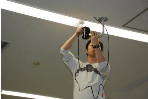
写真 4 上面からの撮影

本研究を行うにあたり、上面からの撮影が課題の1つであった。試撮影では、カメラの設置が困難で体育館の周り廊下の部分にカメラを設置して撮影した。今回 SSTC にて撮影した際には、センターの天井にカメラを固定する器具を設置し、そこに HD ビデオカメラを取り付けて（写真 4）その真下に跳び箱を設置した。A 小学校で撮影した際には、舞台の上の渡り廊下に設置した。