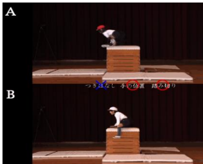
写真 7 比較映像（文字情報あり）

今回、小学生の実技を撮影した中から、うまく跳べる子の映像とうまく跳べない子の映像を選び、上下に並べて比較した。これによって、踏切位置や手の着く位置、空中動作・姿勢、手のつき放し、着地といった開脚跳びのポイントごとに、どこが違うのか、うまくなるためにはどうすればいいのか、ということについて児童が自ら学習することが可能になると考えられる（写真 7）。写真 7 は、跳び箱のつき放しについて比較したものである。