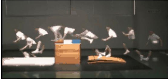
写真 6 残像効果を付けた映像

映像処理ソフトを用いて、これらの映像に残像効果を付けることにより、より動きの変化が理解できるような映像を作成した（写真 6）。これは、静止画として保存すると、これまで使用されてきた連続写真としても利用できる。