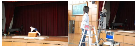
写真3 小学校での撮影の様子

また同月下旬には、A小学校の3年生を対象に、開脚跳びを撮影した(写真3)。A小学校の体育館の舞台に跳び箱を設定し、正面、前面、後面、上面の4方向から同時に撮影を行った。この撮影においても、前段で述べた動作分析の専門家2名に協力していただいた。児童全員に開脚跳びをしてもらい、その中でうまく跳べない2名にポイントをつけて撮影した。