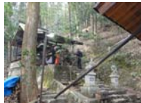
122_伊勢神楽奉納【博物館】121