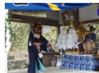
039_伊勢神楽奉納【博物館】038