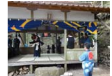
120_伊勢神楽奉納【博物館】119