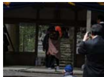
077_伊勢神楽奉納【博物館】076