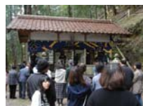
043_伊勢神楽奉納【博物館】042