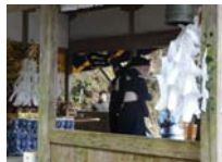
127_伊勢神楽奉納【博物館】126