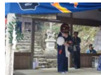
034_伊勢神楽奉納【博物館】033