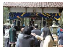
049_伊勢神楽奉納【博物館】048