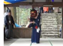
109_伊勢神楽奉納【博物館】108