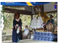
041_伊勢神楽奉納【博物館】040