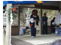
024_伊勢神楽奉納【博物館】023