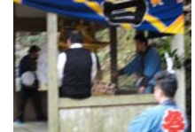
105_伊勢神楽奉納【博物館】104