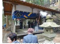
059_伊勢神楽奉納【博物館】058