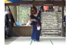
110_伊勢神楽奉納【博物館】109