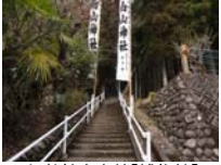
056_伊勢神楽奉納【博物館】055