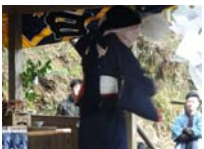
131_伊勢神楽奉納【博物館】130