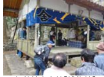
007_伊勢神楽奉納【博物館】006