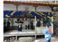
119_伊勢神楽奉納【博物館】118