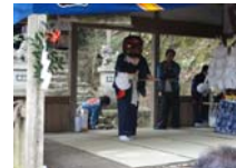
025_伊勢神楽奉納【博物館】024