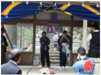
066_伊勢神楽奉納【博物館】065