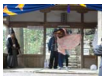
097_伊勢神楽奉納【博物館】096