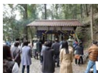
047_伊勢神楽奉納【博物館】046