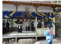
118_伊勢神楽奉納【博物館】117