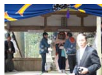
100_伊勢神楽奉納【博物館】099