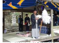
060_伊勢神楽奉納【博物館】059