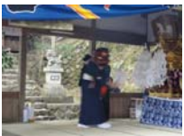
031_伊勢神楽奉納【博物館】030