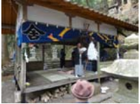
061_伊勢神楽奉納【博物館】060