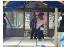
070_伊勢神楽奉納【博物館】069