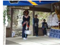
019_伊勢神楽奉納【博物館】018