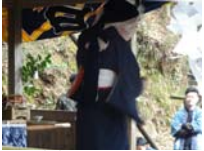
001_伊勢神楽奉納【博物館】000