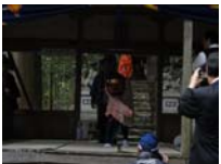
076_伊勢神楽奉納【博物館】075