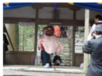
082_伊勢神楽奉納【博物館】081