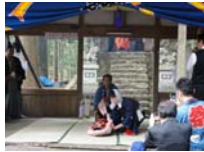
068_伊勢神楽奉納【博物館】067