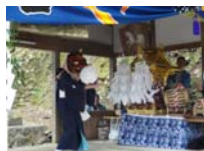
037_伊勢神楽奉納【博物館】036