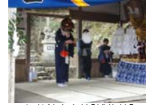
010_伊勢神楽奉納【博物館】009