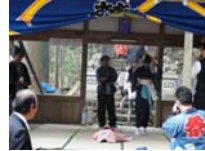
065_伊勢神楽奉納【博物館】064