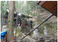
121_伊勢神楽奉納【博物館】120