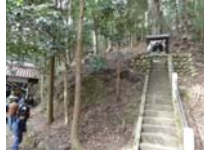
052_伊勢神楽奉納【博物館】051