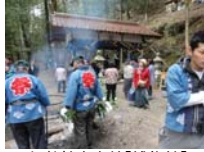
058_伊勢神楽奉納【博物館】057