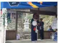
036_伊勢神楽奉納【博物館】035