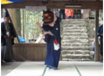
111_伊勢神楽奉納【博物館】110