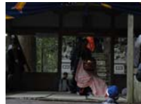
074_伊勢神楽奉納【博物館】073