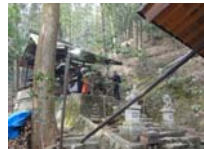
123_伊勢神楽奉納【博物館】122