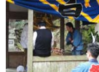
104_伊勢神楽奉納【博物館】103