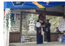
035_伊勢神楽奉納【博物館】034