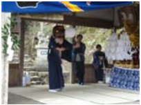
016_伊勢神楽奉納【博物館】015