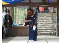
108_伊勢神楽奉納【博物館】107