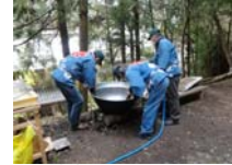
005_伊勢神楽奉納【博物館】004