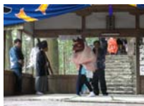
088_伊勢神楽奉納【博物館】087