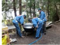
002_伊勢神楽奉納【博物館】001