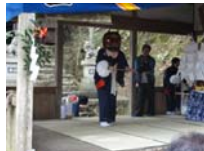
022_伊勢神楽奉納【博物館】021