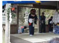
023_伊勢神楽奉納【博物館】022