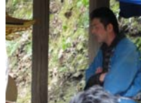
103_伊勢神楽奉納【博物館】102