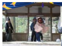
094_伊勢神楽奉納【博物館】093