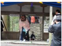
086_伊勢神楽奉納【博物館】085