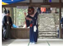
107_伊勢神楽奉納【博物館】106