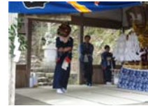
020_伊勢神楽奉納【博物館】019