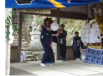
014_伊勢神楽奉納【博物館】013