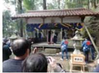
053_伊勢神楽奉納【博物館】052