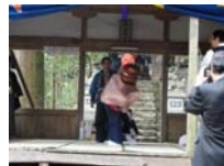
079_伊勢神楽奉納【博物館】078