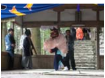
091_伊勢神楽奉納【博物館】090