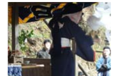
130_伊勢神楽奉納【博物館】129