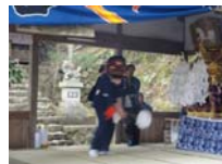
033_伊勢神楽奉納【博物館】032