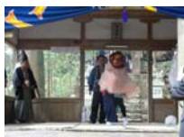
093_伊勢神楽奉納【博物館】092