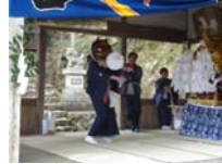
013_伊勢神楽奉納【博物館】012