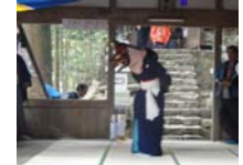
115_伊勢神楽奉納【博物館】114