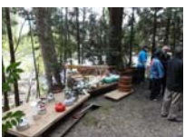
046_伊勢神楽奉納【博物館】045