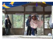
095_伊勢神楽奉納【博物館】094