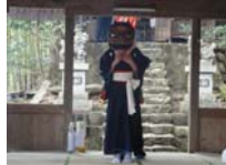
102_伊勢神楽奉納【博物館】101