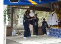
015_伊勢神楽奉納【博物館】014