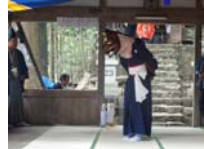
113_伊勢神楽奉納【博物館】112