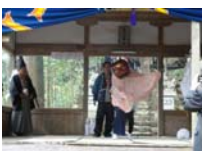
096_伊勢神楽奉納【博物館】095