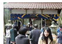
050_伊勢神楽奉納【博物館】049