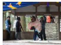
090_伊勢神楽奉納【博物館】089