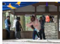
089_伊勢神楽奉納【博物館】088