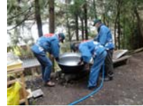
004_伊勢神楽奉納【博物館】003