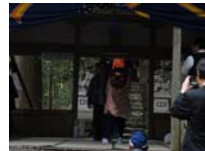
075_伊勢神楽奉納【博物館】074