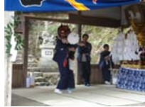
012_伊勢神楽奉納【博物館】011