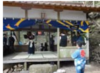
117_伊勢神楽奉納【博物館】116