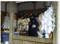
126_伊勢神楽奉納【博物館】125