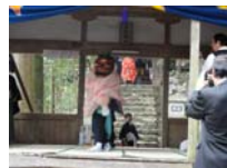
084_伊勢神楽奉納【博物館】083