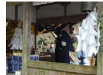
124_伊勢神楽奉納【博物館】123