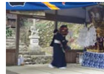
030_伊勢神楽奉納【博物館】029