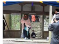
085_伊勢神楽奉納【博物館】084