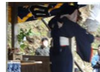
129_伊勢神楽奉納【博物館】128