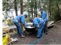
003_伊勢神楽奉納【博物館】002