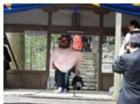
083_伊勢神楽奉納【博物館】082