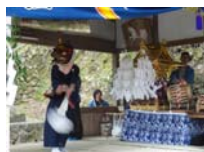
042_伊勢神楽奉納【博物館】041