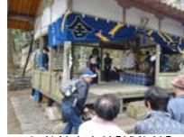
008_伊勢神楽奉納【博物館】007