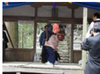
078_伊勢神楽奉納【博物館】077