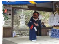
028_伊勢神楽奉納【博物館】027