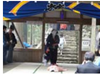
067_伊勢神楽奉納【博物館】066