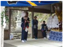
021_伊勢神楽奉納【博物館】020