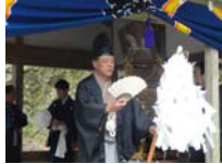
063_伊勢神楽奉納【博物館】062