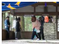
087_伊勢神楽奉納【博物館】086