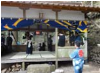
116_伊勢神楽奉納【博物館】115