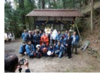
055_伊勢神楽奉納【博物館】054