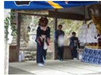
018_伊勢神楽奉納【博物館】017