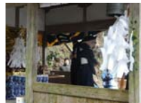
128_伊勢神楽奉納【博物館】127