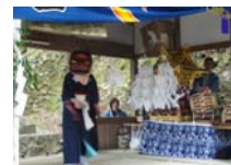
040_伊勢神楽奉納【博物館】039