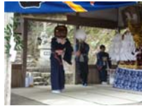
017_伊勢神楽奉納【博物館】016