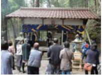
051_伊勢神楽奉納【博物館】050