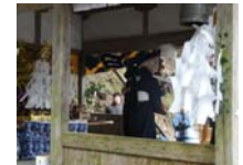
125_伊勢神楽奉納【博物館】124