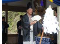
062_伊勢神楽奉納【博物館】061