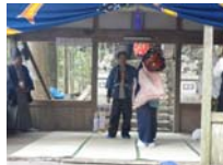
072_伊勢神楽奉納【博物館】071