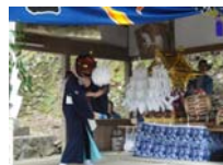
038_伊勢神楽奉納【博物館】037