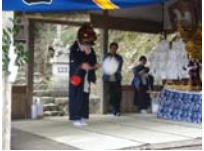
011_伊勢神楽奉納【博物館】010