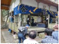
006_伊勢神楽奉納【博物館】005