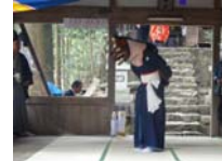
114_伊勢神楽奉納【博物館】113