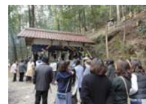
045_伊勢神楽奉納【博物館】044