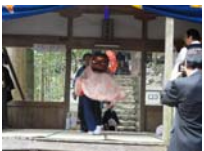
081_伊勢神楽奉納【博物館】080