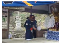
032_伊勢神楽奉納【博物館】031