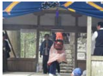
073_伊勢神楽奉納【博物館】072