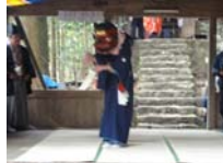
112_伊勢神楽奉納【博物館】111