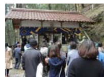
044_伊勢神楽奉納【博物館】043