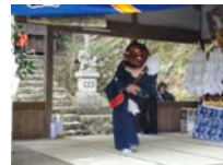
029_伊勢神楽奉納【博物館】028