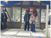
071_伊勢神楽奉納【博物館】070