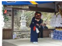
027_伊勢神楽奉納【博物館】026