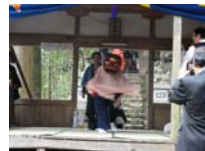
080_伊勢神楽奉納【博物館】079