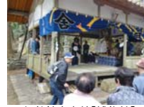
009_伊勢神楽奉納【博物館】008