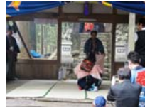
069_伊勢神楽奉納【博物館】068