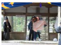
098_伊勢神楽奉納【博物館】097