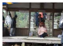
099_伊勢神楽奉納【博物館】098