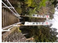
057_伊勢神楽奉納【博物館】056