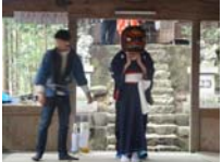
101_伊勢神楽奉納【博物館】100