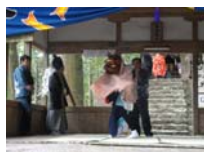
092_伊勢神楽奉納【博物館】091