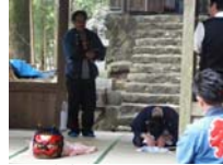
054_伊勢神楽奉納【博物館】053