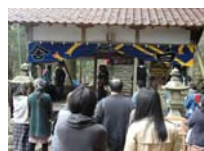
048_伊勢神楽奉納【博物館】047