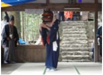
106_伊勢神楽奉納【博物館】105