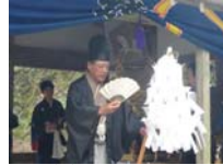
064_伊勢神楽奉納【博物館】063