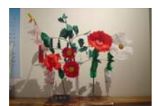
4559_H30延年華づくり講座写真009