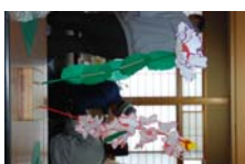
4539_延年華講座写真003