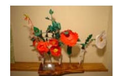
4563_H30延年華づくり講座写真013