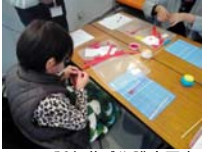
4619_H30延年華づくり講座写真069