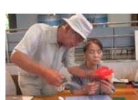
4602_H30延年華づくり講座写真052