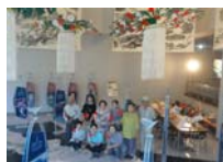
4580_H30延年華づくり講座写真030