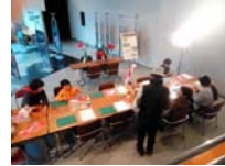
4617_H30延年華づくり講座写真067