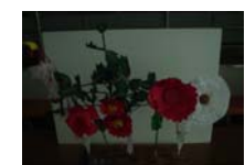
4558_H30延年華づくり講座写真008