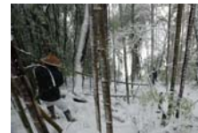
4518_延年竹切り【博物館】010