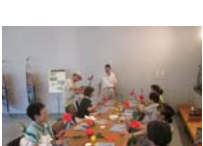
4609_H30延年華づくり講座写真059