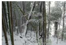
4515_延年竹切り【博物館】007