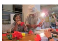
4595_H30延年華づくり講座写真045