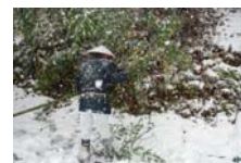
4528_延年竹切り【博物館】020