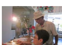
4600_H30延年華づくり講座写真050