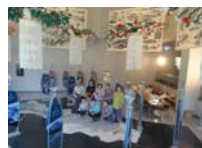
4582_H30延年華づくり講座写真032