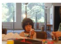
4586_H30延年華づくり講座写真036