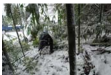
4524_延年竹切り【博物館】016