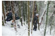
4511_延年竹切り【博物館】003