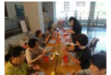
4578_H30延年華づくり講座写真028