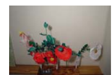
4562_H30延年華づくり講座写真012