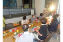
4573_H30延年華づくり講座写真023