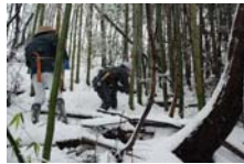
4510_延年竹切り【博物館】002