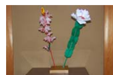
4548_延年華講座写真【博物館撮影】012