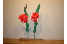
4568_H30延年華づくり講座写真018