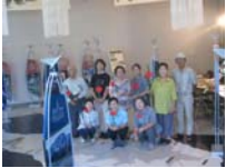
4614_H30延年華づくり講座写真064