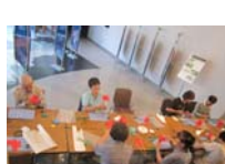
4605_H30延年華づくり講座写真055