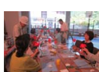
4607_H30延年華づくり講座写真057