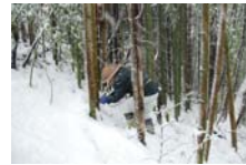
4512_延年竹切り【博物館】004