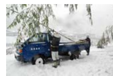
4533_延年竹切り【博物館】025