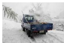
4531_延年竹切り【博物館】023