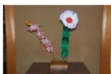
4540_延年華講座写真【博物館撮影】004