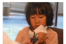
4583_H30延年華づくり講座写真033