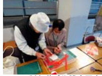
4621_H30延年華づくり講座写真071