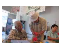
4601_H30延年華づくり講座写真051