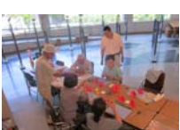
4594_H30延年華づくり講座写真044