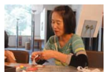
4588_H30延年華づくり講座写真038