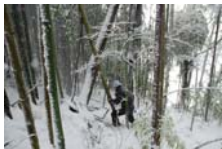
4514_延年竹切り【博物館】006