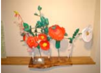
4564_H30延年華づくり講座写真014