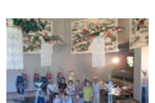
4613_H30延年華づくり講座写真063