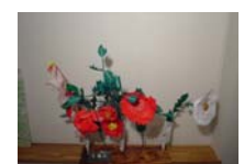
4561_H30延年華づくり講座写真011