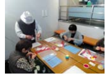
4618_H30延年華づくり講座写真068