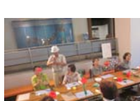
4611_H30延年華づくり講座写真061