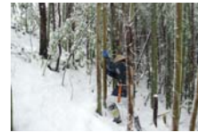
4513_延年竹切り【博物館】005