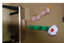
4541_延年華講座写真【博物館撮影】005