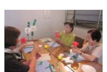
4603_H30延年華づくり講座写真053