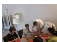
4591_H30延年華づくり講座写真041