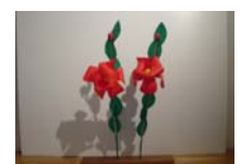
4555_H30延年華づくり講座写真005