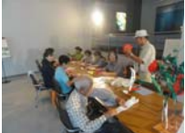
4569_H30延年華づくり講座写真019