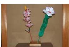
4549_延年華講座写真【博物館撮影】013