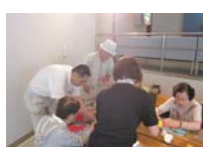
4590_H30延年華づくり講座写真040