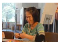
4585_H30延年華づくり講座写真035