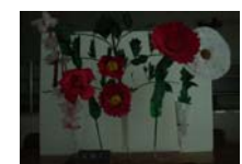
4557_H30延年華づくり講座写真007