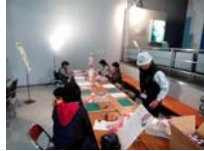
4615_H30延年華づくり講座写真065