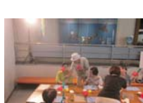
4610_H30延年華づくり講座写真060