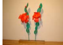
4567_H30延年華づくり講座写真017