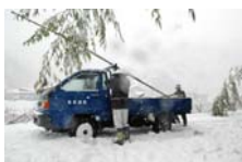
4534_延年竹切り【博物館】026