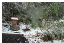
4535_延年竹切り【博物館】027