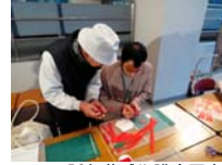
4622_H30延年華づくり講座写真072