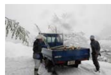
4532_延年竹切り【博物館】024