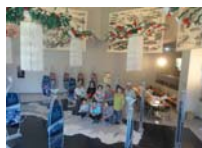
4581_H30延年華づくり講座写真031