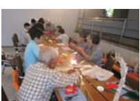
4589_H30延年華づくり講座写真039