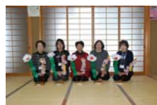
4536_延年華講座写真【博物館撮影】000