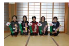
4538_延年華講座写真002