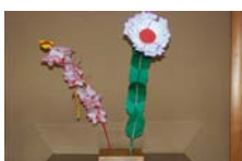
4544_延年華講座写真【博物館撮影】008