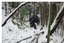
4520_延年竹切り【博物館】012