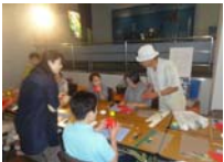
4574_H30延年華づくり講座写真024