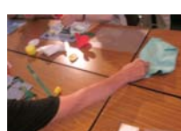
4597_H30延年華づくり講座写真047