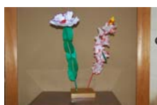
4545_延年華講座写真【博物館撮影】009