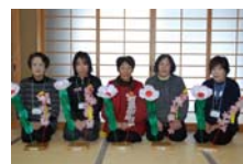
4537_延年華講座写真【博物館撮影】001