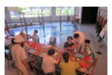
4593_H30延年華づくり講座写真043