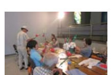
4608_H30延年華づくり講座写真058