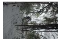
4523_延年竹切り【博物館】015