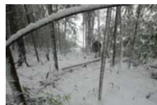
4521_延年竹切り【博物館】013