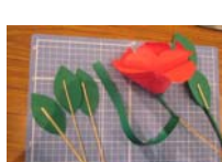
4606_H30延年華づくり講座写真056