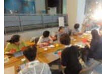
4572_H30延年華づくり講座写真022