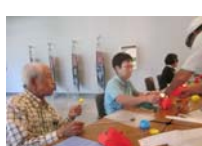
4596_H30延年華づくり講座写真046