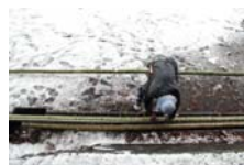
4526_延年竹切り【博物館】018