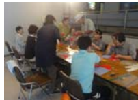
4576_H30延年華づくり講座写真026