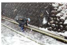
4529_延年竹切り【博物館】021