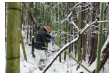
4517_延年竹切り【博物館】009