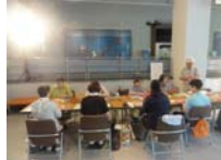
4570_H30延年華づくり講座写真020