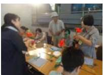
4579_H30延年華づくり講座写真029