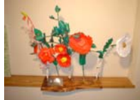
4565_H30延年華づくり講座写真015