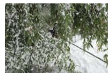
4527_延年竹切り【博物館】019