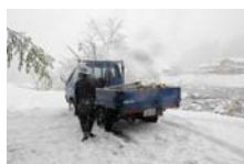
4530_延年竹切り【博物館】022