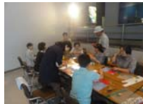
4575_H30延年華づくり講座写真025