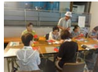
4577_H30延年華づくり講座写真027