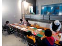
4616_H30延年華づくり講座写真066