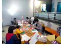
4620_H30延年華づくり講座写真070