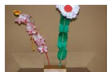
4542_延年華講座写真006