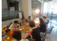
4571_H30延年華づくり講座写真021