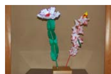
4547_延年華講座写真【博物館撮影】011