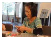
4587_H30延年華づくり講座写真037