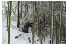
4516_延年竹切り【博物館】008