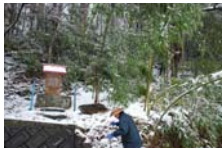
4509_延年竹切り【博物館】001