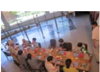
4604_H30延年華づくり講座写真054