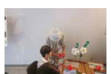
4598_H30延年華づくり講座写真048