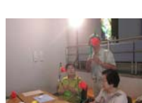
4612_H30延年華づくり講座写真062