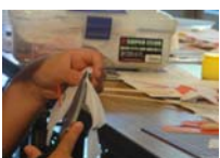
4584_H30延年華づくり講座写真034