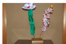
4546_延年華講座写真【博物館撮影】010