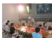
4592_H30延年華づくり講座写真042