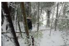
4519_延年竹切り【博物館】011