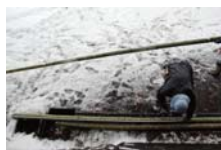
4525_延年竹切り【博物館】017