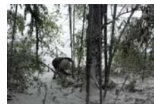
4522_延年竹切り【博物館】014