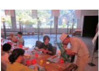
4599_H30延年華づくり講座写真049