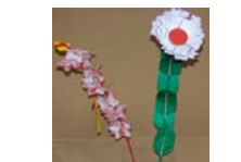
4543_延年華講座写真【博物館撮影】007