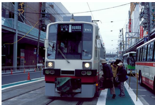
岐阜市内線 新岐阜駅前 乗降の様子

岐阜市内線は、岐阜駅前駅から忠節駅まで、および徹明町駅から長良北町駅までを結んでいた名古屋鉄道の軌道線であり、岐阜県岐阜市内を走行していたが、2005年4月1日に全線が廃止された。廃線にともなうデジタルアーカイブは、現在では撮影することのできない映像である。