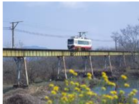
揖斐線 黒野行 伊自良川尻毛橋付近

本学では、当時、消え去っていく電車の様子は写真等で残すだけでは、電車が運行されていたとき、乗車した人の状況はどんな状態にあったのか、駅間の乗車時間や停車時間、車窓からの風景の移り変わりなど時間的なプロセスをとまなう情報は失われてしまうと考える。名鉄岐阜市内線、揖斐線、美濃町線（田神線を含む）について、ビデオカメラで出発駅から到着駅までの電車の進行方向の車窓をすべて撮影した。撮影された映像は、走行中の車内から前方の車窓の様子を出発駅から到着駅までの走行中様子が記録されており、走行中の時間的なプロセスを忠実に再現することができる。