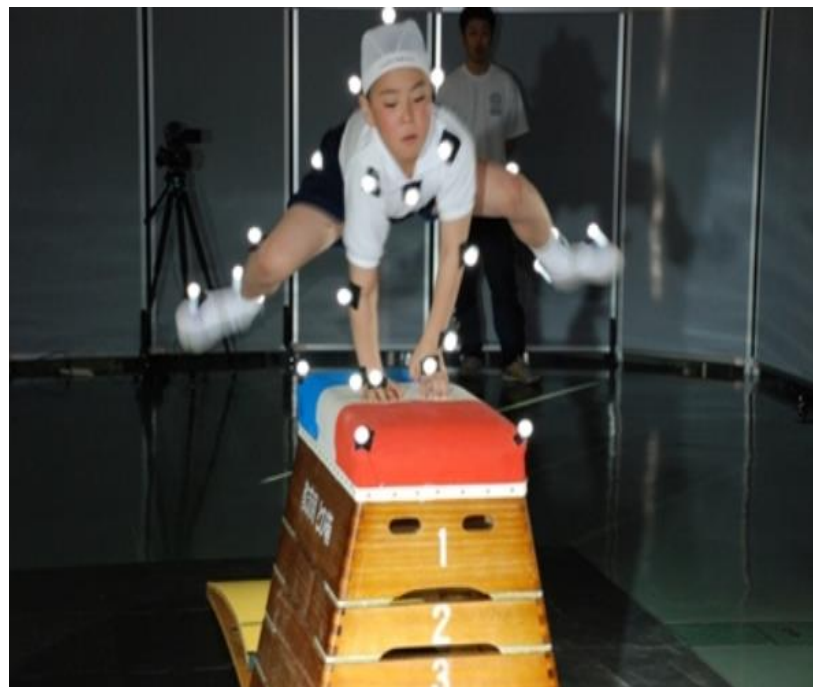
写真1 ポイントをつけた撮影