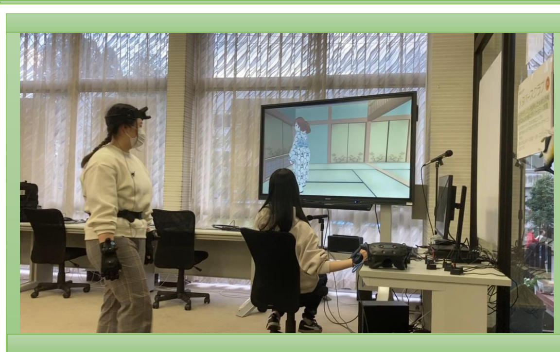
岐阜女子大学メタバースクラブ