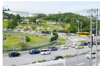
イオンモール沖縄ライカム駐車場から見たライカムハウジングエリア ；黄色のバスは米軍基地内のインターナショナルスクールの通学バスである。