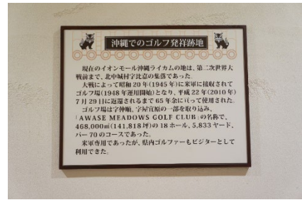
イオンモール沖縄ライカムと店内の説明板

米軍基地内ライカムハウジングエリアはイオンモール沖縄ライカムの駐車場からも見ることができ、フェンスの中は芝生が広がり家々が立ち並んでいる。